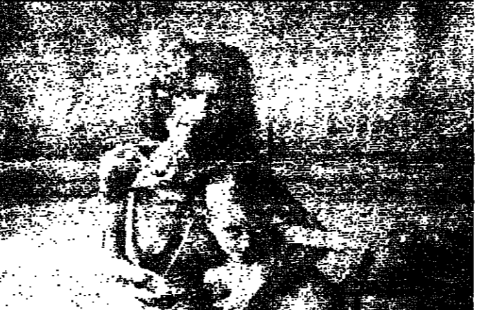
ام وظلها ... سكتان عظيمين يستحقان